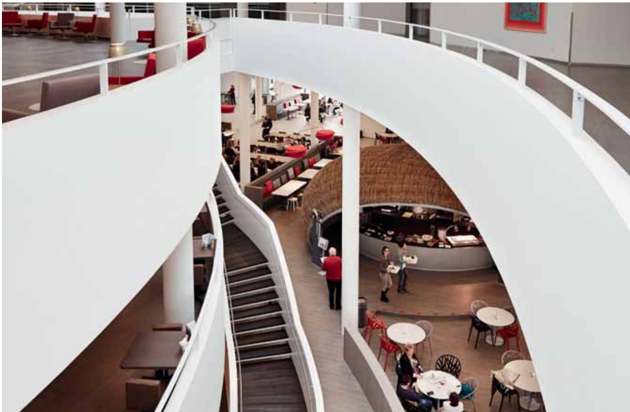
FOTO BOVEN Doorkijk vanaf het vergadercentrum naar het restaurant