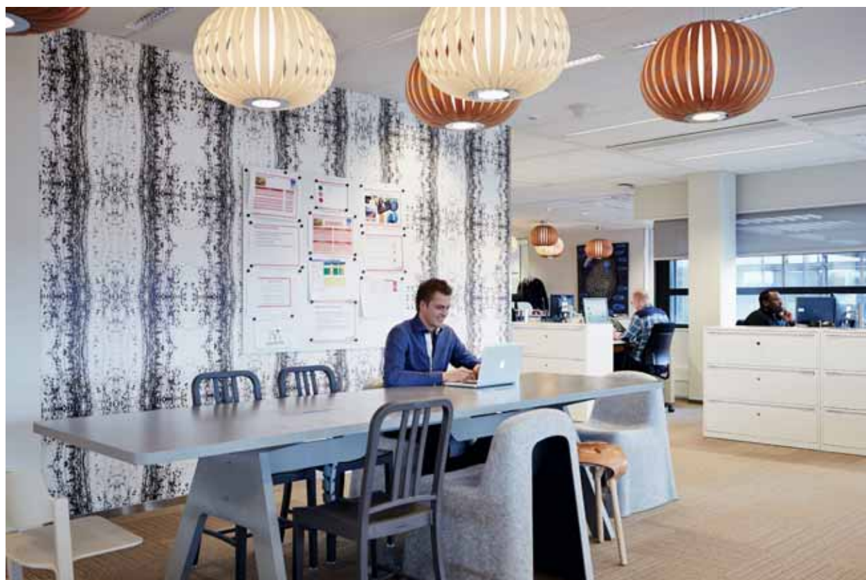
FOTO ONDER Op de kantoor- afdelingen worden diverse soorten werkplekken gecombineerd. Behang van Melissa Peen, kasten van Triumph via !Pet

TEKENING RECHTS Niveau drie, het vergadercentrum